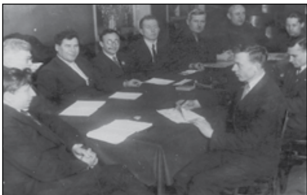
▲ Прийом державних екзаменів 1938 р.

У цих двох відправних пунктах, мов у казані, клекоче життя. Чи в шесті ділових паперів, чи в мережаних узорах таблиць, схем, зведень, чи в живих бесідах, – в усьому діє не-