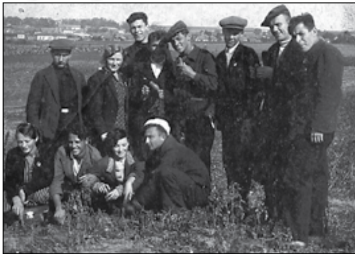
▲ Учгосп Іванівка, польова практика 1939-1940 рр.