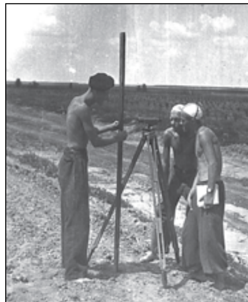
▲ Польова практика по геодезії. Учгосп Іванівка 1939-1940 рр.

Це справжня «піднята цілина», яка раділа б, коли у добі було б 36 годин, щоб можна було б здобути більше знань. Працюють, не відпочиваючи. Далеко за північ, у гуртожитках біля